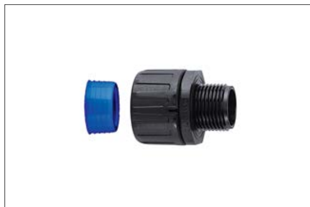
HelaGuard HGL-S Raccordo diritto con guarnizione, IP68.