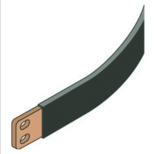
Descrizione Bandella flessibile Corrente nominale 160 A