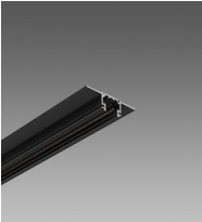
Binario 48V DC MICRO T: per controsoffitti in cartongesso