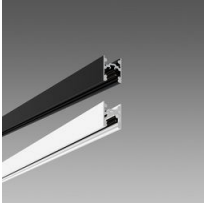
Binario 48V DC MICRO H: sospensione