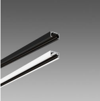
Binario 48V DC MICRO P: parete plafone