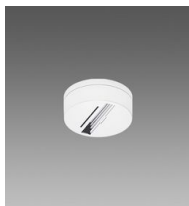
Acc. basetta per adattatore universale e DIMM 1/10V-DALI