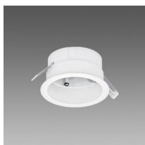
Acc. per incasso