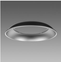
Riflettore Lucente 3.1 - UGR<25