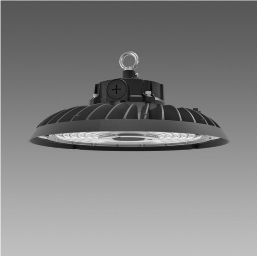
3700 Lucente 3.1