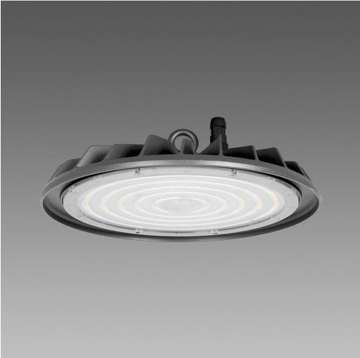
3500 Argon 3.1