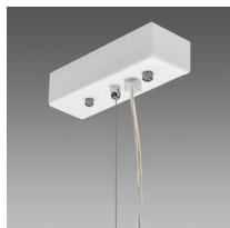
Sospensione elettrificata Q - 5 poli