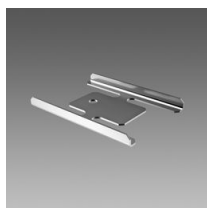
Staffa di giunzione - Liset 2.0