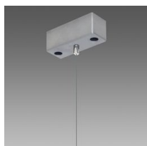
Sospensione semplice Q