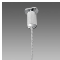
Sospensione semplice acciaio