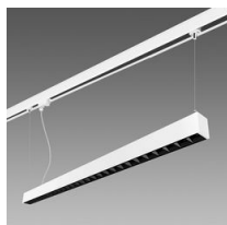
Attacco a sospensione per binario