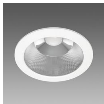
Techno B 232 - CCT - DIP SWITCH