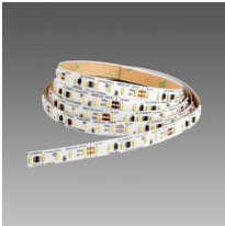
Strip - LED 24V - CRI>90