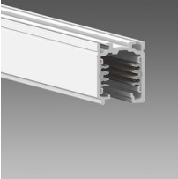
Omnitrack PLUS - 6 conduttori