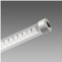
Micro Liset - cilindrica con LENTI - PROFESSIONAL