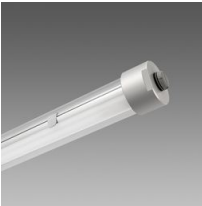
Micro Liset - Cilindrica Professional