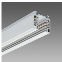
Omnitrack 3 accensioni