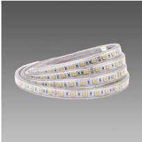
Strip 120LED - IP65 - CRI 80 - 24V - 120lm-W