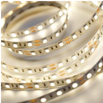
Strip 120LED - IP20 - CRI 80 - 24V - 100lm-W