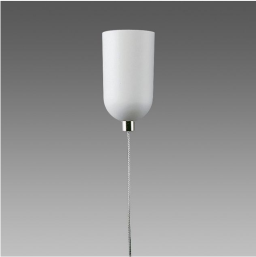
cavetto in acciaio (l=1,5m) con dispositivo per regolazione millimetrica. Carico max: 20 Kg.