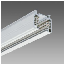
Omnitrack 3 accensioni