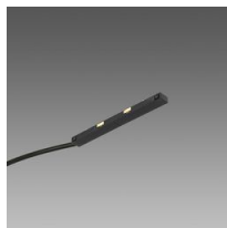
Alimentazione a scomparsa per Binario MICRO