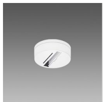
Basetta per adattatore universale e DIMM 1/10V-DALI