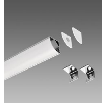
Profilo A - angolare