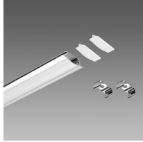
Profilo B - incasso