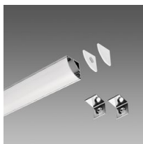
Profilo A - angolare