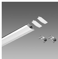
Profilo B - incasso