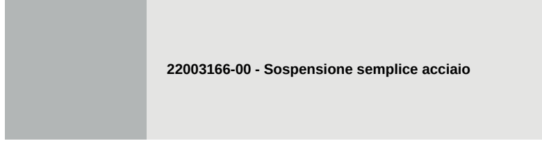
22003166-00 - Sospensione semplice acciaio