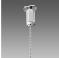
Sospensione semplice acciaio