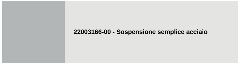
22003166-00 - Sospensione semplice acciaio