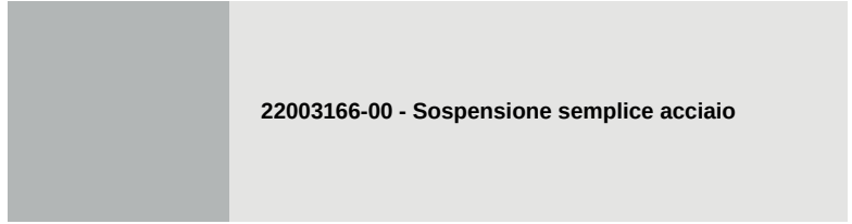
22003166-00 - Sospensione semplice acciaio