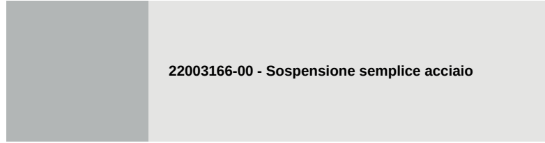
22003166-00 - Sospensione semplice acciaio