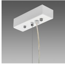
Sospensione elettrificata Q