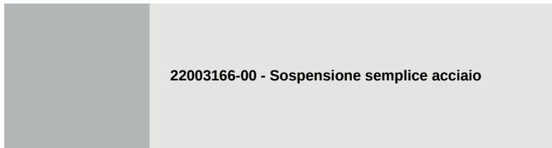
22003166-00 - Sospensione semplice acciaio