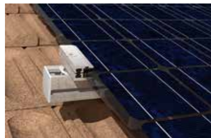
Dettaglio: morsetto finale MF G