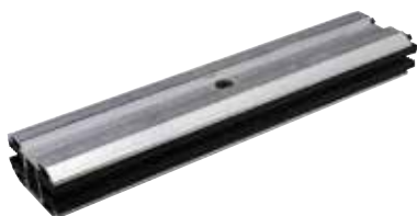
Morsetto non assemblato centrale per vetro e moduli senza cornice MC G