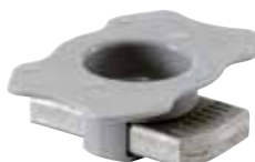
Dado testa a martello FCN AL