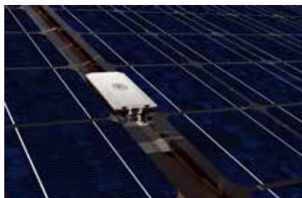
Dettaglio: morsetto centrale MC G