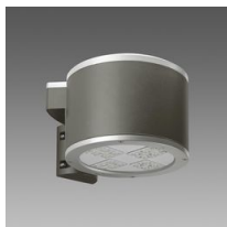
1777 Musa LED ciclopedonale