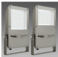
1888 Rodio LED HP - simmetrico fascio stretto