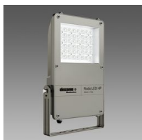
1891 Rodio HE - simmetrico diffondente