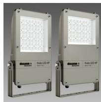
1887 Rodio LED HP - asimmetrico