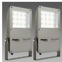
1890 Rodio LED HP - simmetrico fascio largo