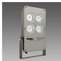
1897 Rodio HP - COB simmetrico