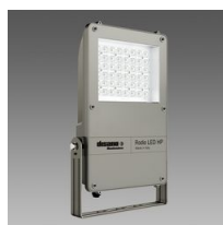
1887 Rodio HE - asimmetrico