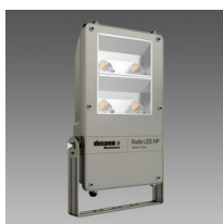
1898 Rodio HP - COB asimmetrico