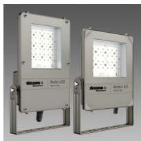
1890 Rodio LED - simmetrico fascio largo