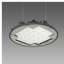
2884 Saturno ø370 UGR<25 - ellittico