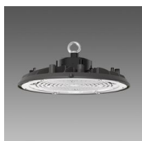
2885 Saturno ø370 - POWER SWITCH