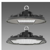
2883 Saturno ø370 UGR<25 - diffondente