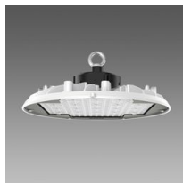
2888 Saturno ø370 bianco UGR<25 - diffondente