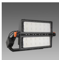
2196 Forum 2.0 - 2 MODULI - fascio stretto - XS