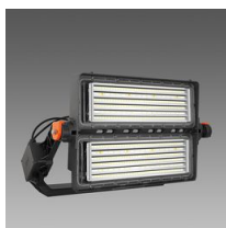
2198 Forum 2.0 HE - 2 MODULI - simmetrico