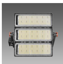
3192 Forum 2.0 - 3 MODULI - simmetrico - W