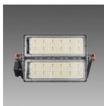
2192 Forum 2.0 - 2 MODULI - simmetrico - W