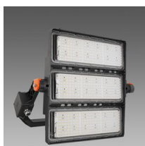
3198 Forum 2.0 - 3 MODULI - fascio stretto - S