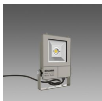
1980 Micro Rodio - COB