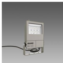
1983 Micro Rodio - simmetrico fascio stretto