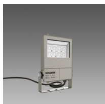
1984 Micro Rodio - simmetrico diffondente