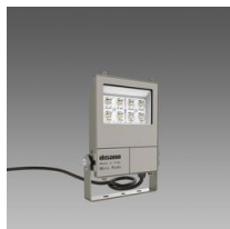
1982 Micro Rodio - asimmetrico