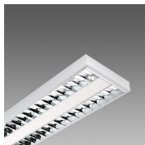
731 Minicomfort R LED - UGR<16