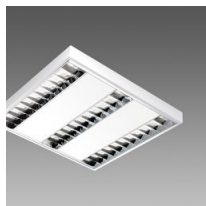
731 Minicomfort LED x3 - UGR<16