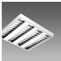
731 Minicomfort LED x4 - UGR<16