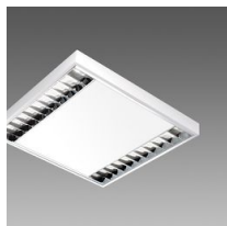
731 Minicomfort LED x2 - UGR<16