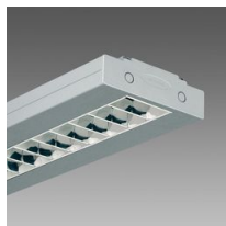
3878 Channel - luce diretta e indiretta