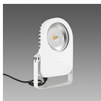
1710 Cripto COB small - diffondente