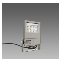
1982 Micro Rodio - asimmetrico