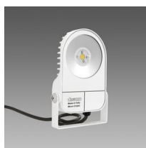
1700 Cripto micro - COB