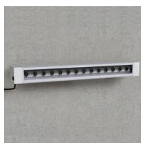
1775 Sicura - ellittico LED