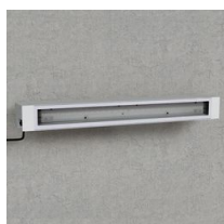
1768 Sicura - FS simmetrico LED