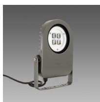
1712 Cripto small - simmetrico