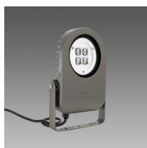
1711 Cripto small - asimmetrico