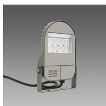
1702 Cripto micro - simmetrico diffondente