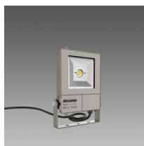
1980 Micro Rodio - COB