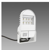
1701 Cripto micro - asimmetrico