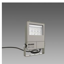
1984 Micro Rodio - simmetrico diffondente