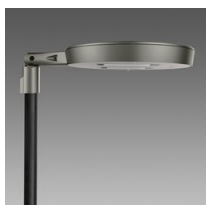
3339 Visconti 2.0 - grandi aree