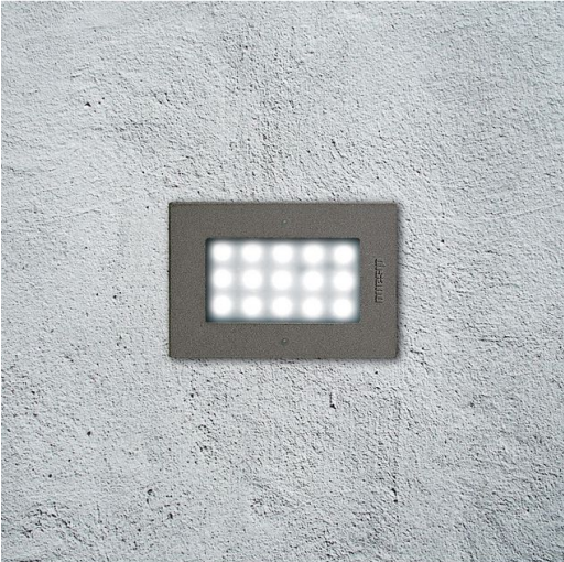
1673 Starled - rettangolare 230V