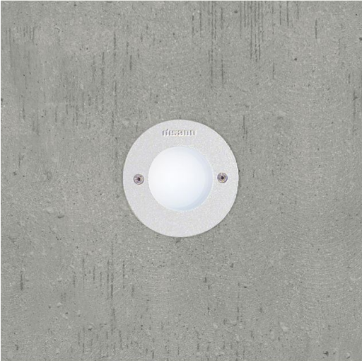
1622 Starled - tondo