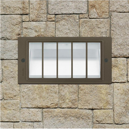
1210 Box LED