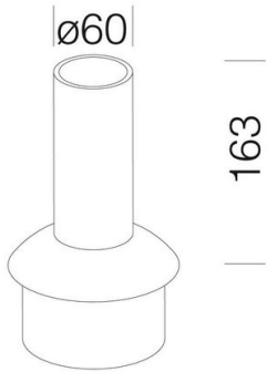
368 Raccordo testa-palo