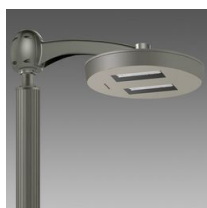
3329 Visconti 2.0 - grandi aree