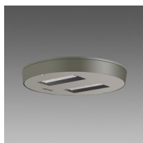
3327 Visconti 2.0 - stradale ME