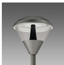
1518 Klima LED anti-inquinamento luminoso