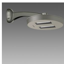
3328 Visconti 2.0 - ciclabile