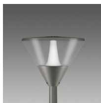
1570 Klima - LED