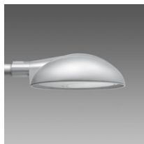
1756 Monza HP - high performance