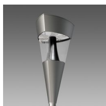
1708 Torcia LED