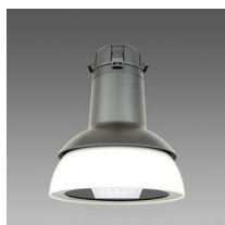
3142 Campana LED