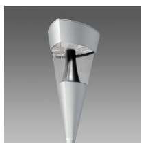
1707 Torcia LED