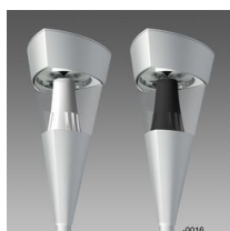
1513 Torcia LED COB