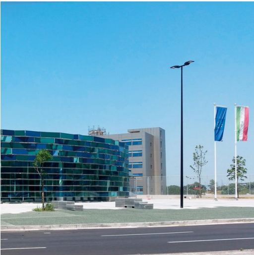
1415 Palo in acciaio con base ø159