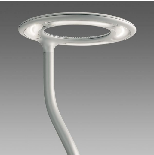
1440 Palo con base