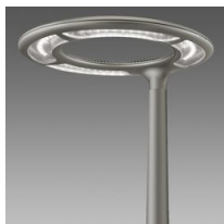
1781 Aura - ciclopedonale