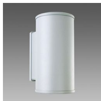
1293 Cilindro 4