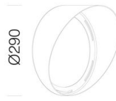
625 convogliatore big