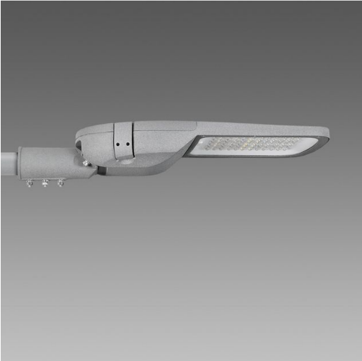
3461 Denia ES 2