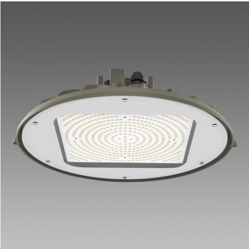
2880 Quark 3.7 - diffusore in vetro temperato