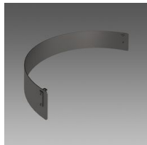
109 Schermo antiabbagliamento