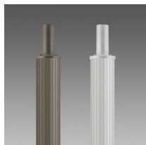
1408 Palo rigato \varnothing 100 con base